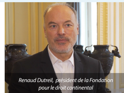
Renaud Dutreil, président de la Fondation pour le droit continental